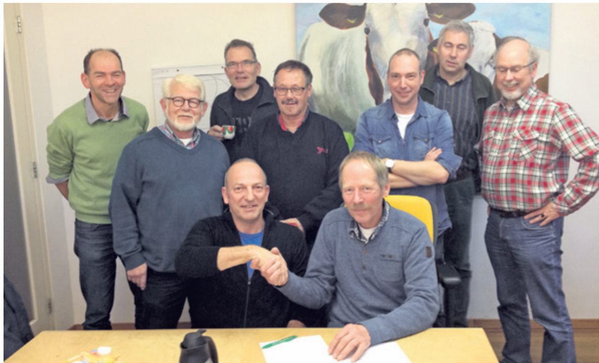
Met het ondertekenen van een overeenkomst is de samenwerking tussen vrijwilligers en de Natuurvereniging bekrachtigd.

heeft budget beschikbaar gesteld om nieuw gereedschap aan te schaffen waarmee het werk uitgevoerd kan worden. De Agrarische Natuurvereniging heeft een aanhangwagen voor het transport van het gereedschap aangeschaft. Heeft u ook interesse om als vrijwilliger een dagje (op proef) mee te werken in het landschapsbeheer? Stuur dan een mail naar info@anvnoorderpark.nl. U ontvangt van de coördinator meer informatie over de werkdagen en de werklocaties. (Natalie Joosten)